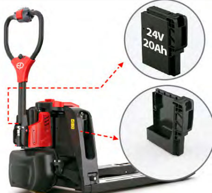
Uso Ocasional Jornada de trabajo estimada: 5,5 horas.

Máxima flexibilidad en las configuraciones para cada aplicación, desde el uso ocasional hasta la tarea pesada. Con un diseño de dos ranuras de alimentación, ofrece la opción de dos baterías de 24V/20Ah para maximizar el tiempo de funcionamiento en aplicaciones de tiempo completo. La configuración estándar de una sola batería viene con un contenedor de almacenamiento portátil para mantener todo fácilmente accesible sobre la marcha. Su versatilidad la convierte en una máquina polivalente, perfecta para realizar diversas tareas de la forma más rentable.